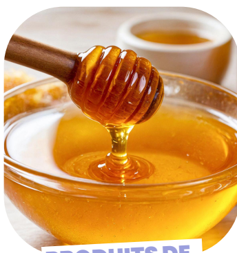
PRODUITS DE LA RUCHE