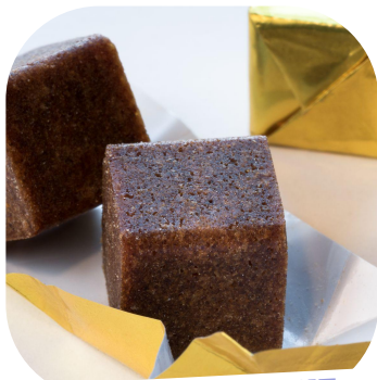
BOUILLON DE BOEUF, DE VOLAILLE, DE GÉLATINE

Ces ingrédients NE RENTRENT PAS dans la composition d'un plat 100 % végétal