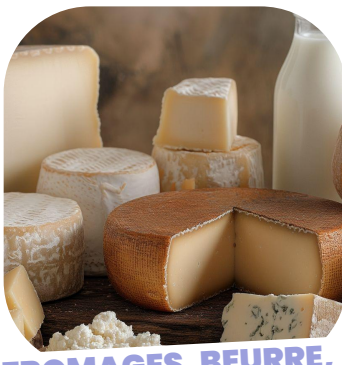
FROMAGES, BEURRE, CRÈME, LAIT