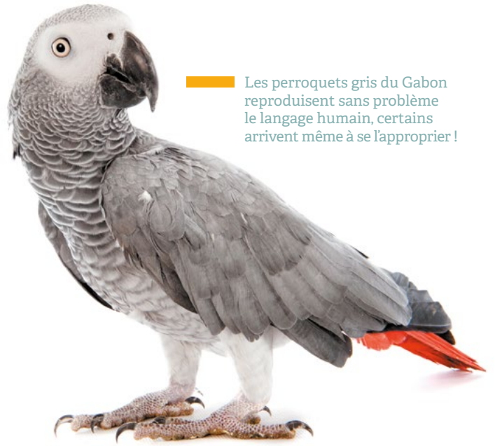
Les perroquets gris du Gabon reproduisent sans problème le langage humain, certains arrivent même à se l'approprier !

D'autres éthologues cherchent à comprendre comment les animaux communiquent même lorsqu'ils n'émettent pas de sons. Ainsi, des chercheurs ont montré qu'un cochon pouvait mentir à un autre animal de son groupe pour atteindre la nourriture avant lui, en trompant l'autre cochon par son attitude. Une chose est sûre, nous avons encore beaucoup à apprendre sur la communication des animaux ! ■