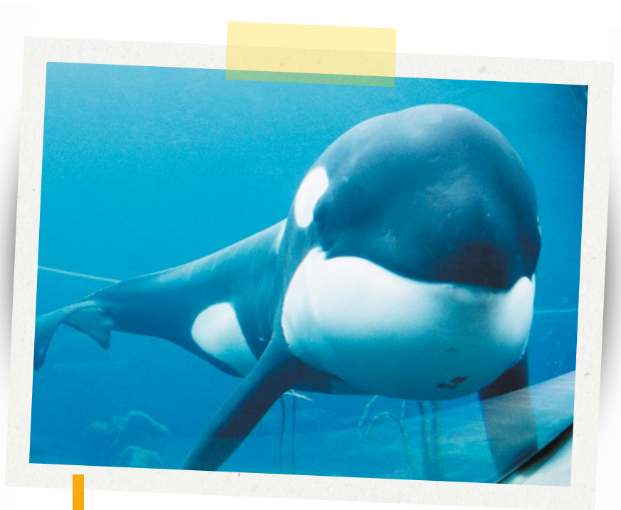
Keiko est devenu la première orque à être relâchée après sa captivité.

C'est en tout cas ce que pense Ric O'Barry. Cet ancien dresseur d'animaux avait capturé puis entraîné les 5 premiers dauphins ayant joué dans la série Flipper . Depuis, il a changé d'idée , et donc... de métier, pour devenir militant pour les droits des animaux. En effet, il est maintenant convaincu que les dauphins ne devraient pas vivre en captivité, ni être chassés. C'est pourquoi il a créé l'association Dolphin Project, qui vient en aide aux dauphins du monde entier. ■