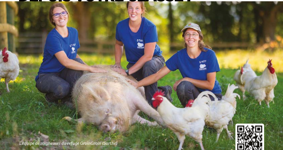
L'équipe de soigneuses du refuge GroinGroin (Sarthe)

À l'aide d'un projecteur et d'une simple connexion internet, dialoguez en direct avec les soigneuses et les soigneurs, rencontrez les animaux, découvrez leurs personnalités et leurs histoires grâce à une caméra embarquée, et partagez le quotidien d'un refuge. Rendez-vous vite sur education.L214.com/animations pour en savoir plus, ou flashez le QR code ci-dessus !