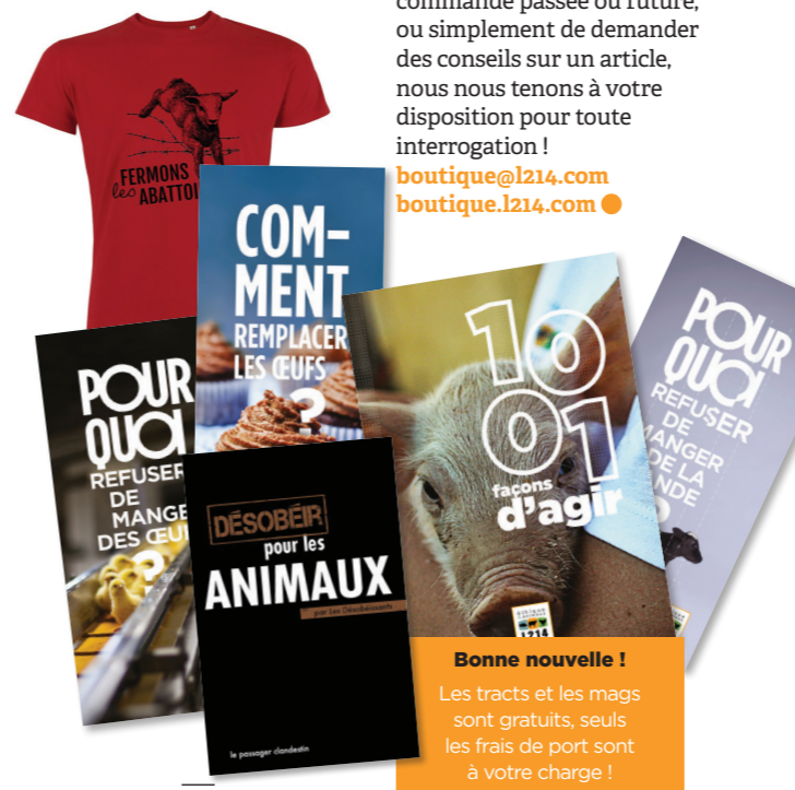
13 AGIR POUR LES ANIMAUX