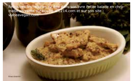
Retrouvez les recettes de Béa dans son livre Petite balade en chromaite en vente sur boutique.L214.com et sur son site : vabeavegan.com